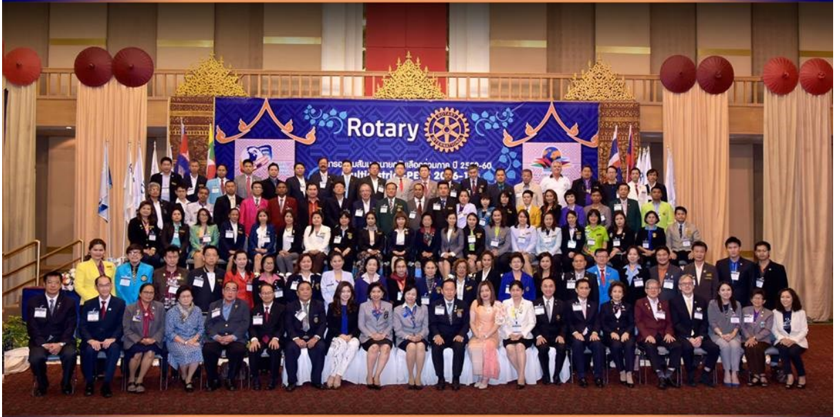
District 3330 Rotary International 26-28 February 2016 : Lotus Pang Suan Kaew Hotel, Chiang Mai THAILAND